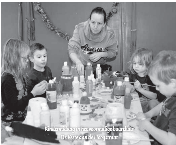
Kindermiddag in het voormalige buurthuis De Veste aan de Hoostraat

Van de bijna driehonderd vragenlijsten die zijn verspreid, ontvingen de buurtverenigingen er bijna honderd terug. Alle respondenten reageerden positief. Mensen hebben behoefte aan ontmoeting en gezelligheid en de bereidheid om elkaar te helpen en voor elkaar te zorgen is groot. Gezond en fijn ouder worden is net zoals samen actief zijn een belangrijk thema.