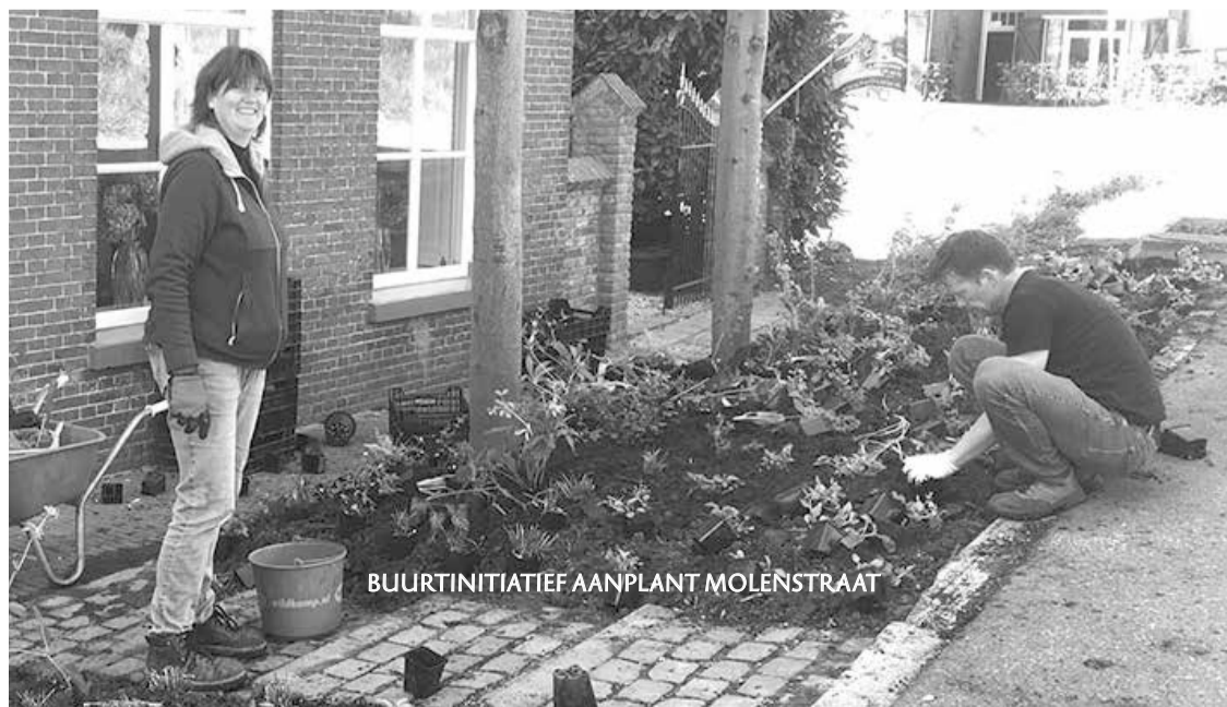
BUURTINITIATIEF AANPLANT MOLENSTRAAT