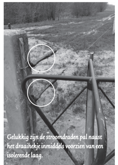
Gelukkig zijn de stroomdraden pal naast het draaihekje inmiddels voorzien van een isolerende laag.

het beheren en beschermen van natuur. "Daarnaast proberen wij zoveel als mogelijk daar de mensen van te laten genieten. Wij maken onze beheer- en inrichtingskeuzes in die volgorde. Na jarenlang getouwtrek over het niet naleven van de openstellingsregels, waar ook regelmatig is gewaarschuwd dat wij andere maatregelen zouden nemen als mensen zich niet aan de regels wilden houden, is nu gekozen voor deze herinrichting."