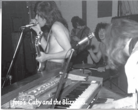
foto's Cuby and the Blizzards.